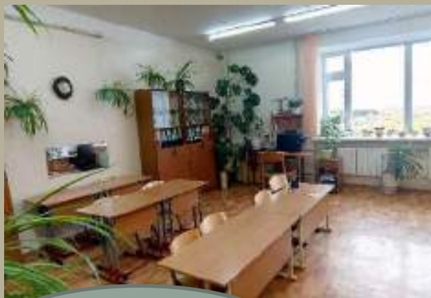
Кабинет учителя- логопеда