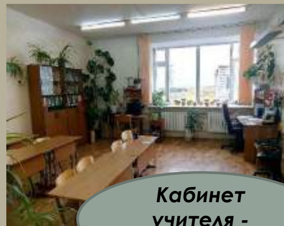
Кабинет учителя - дефектолога