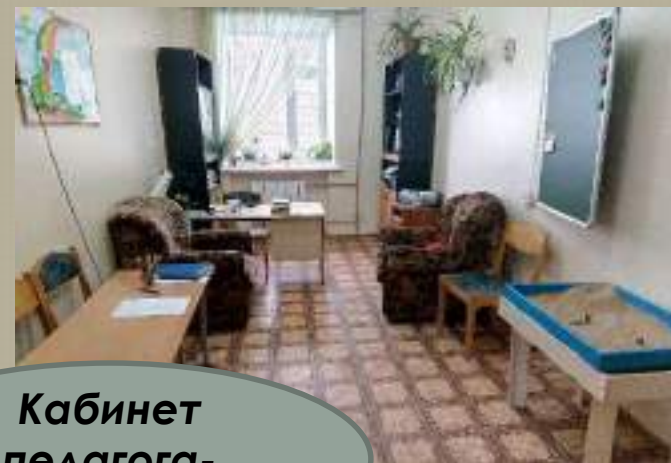
Кабинет педагога- психолога